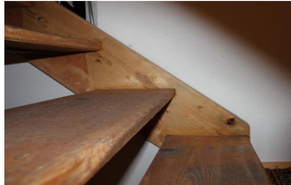
Treppe (mascil-Team Austria)